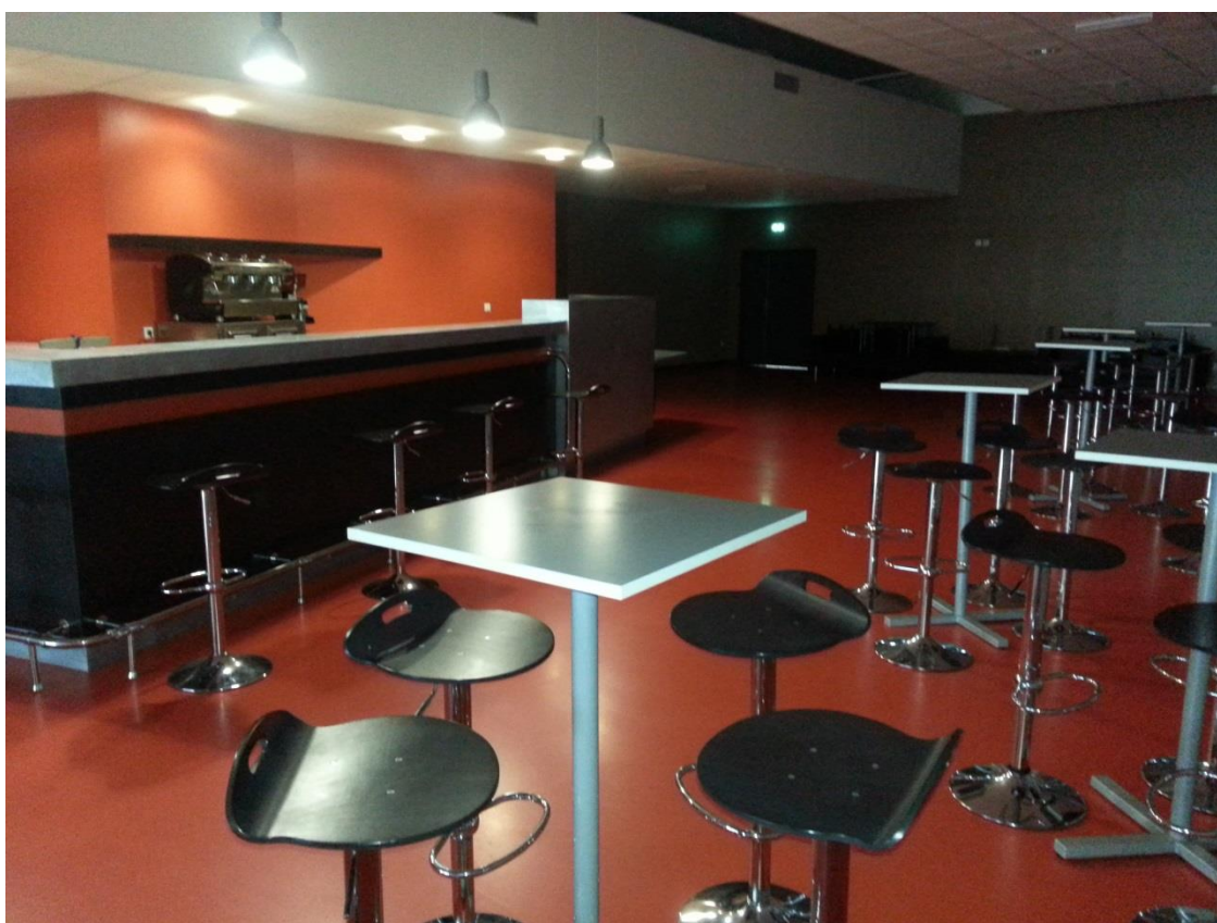
ESPACE BAR ET RESTAURATION