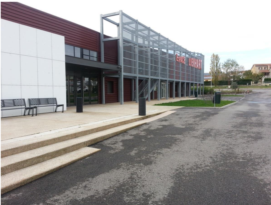
ENTREE ESPACE MARCHÉ